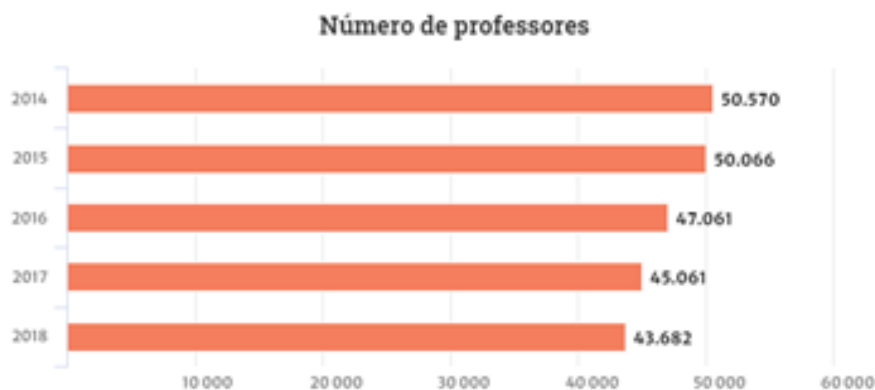
Gráfico 1- Número de professores na Educação Básica no Rio Grande do Sul