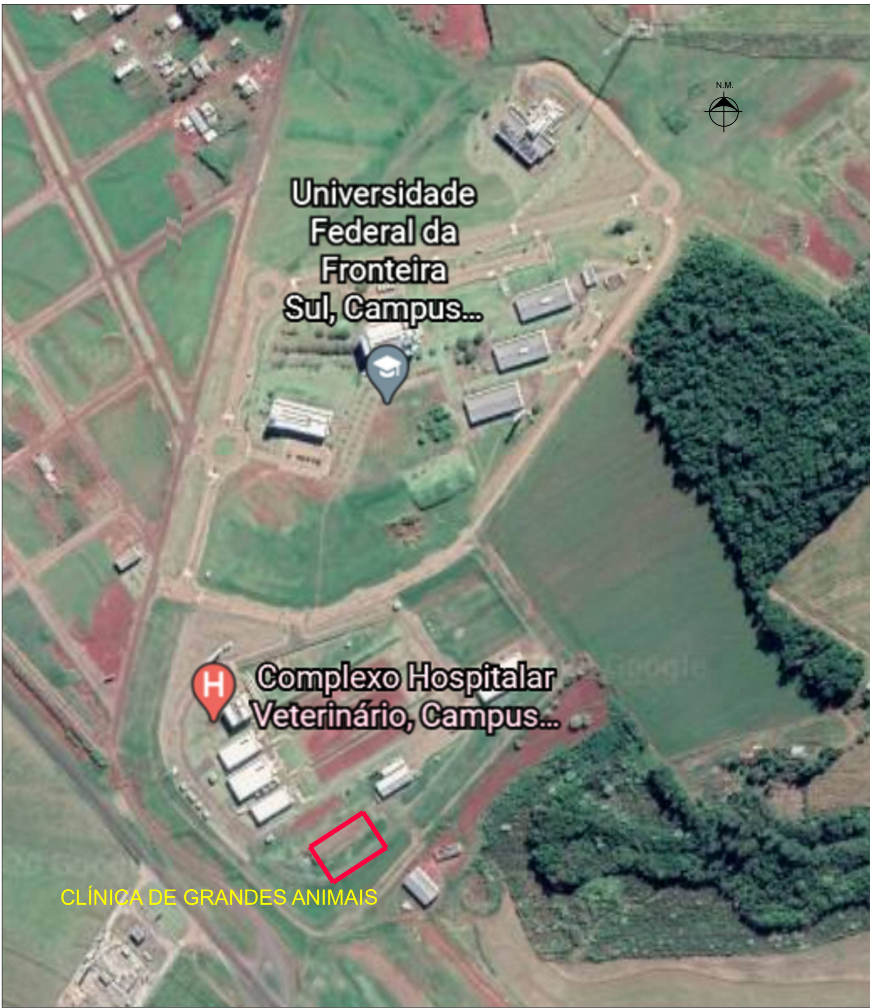
LOCALIZAÇÃO NO CAMPUS UFFS REALEZA SEM ESCALA