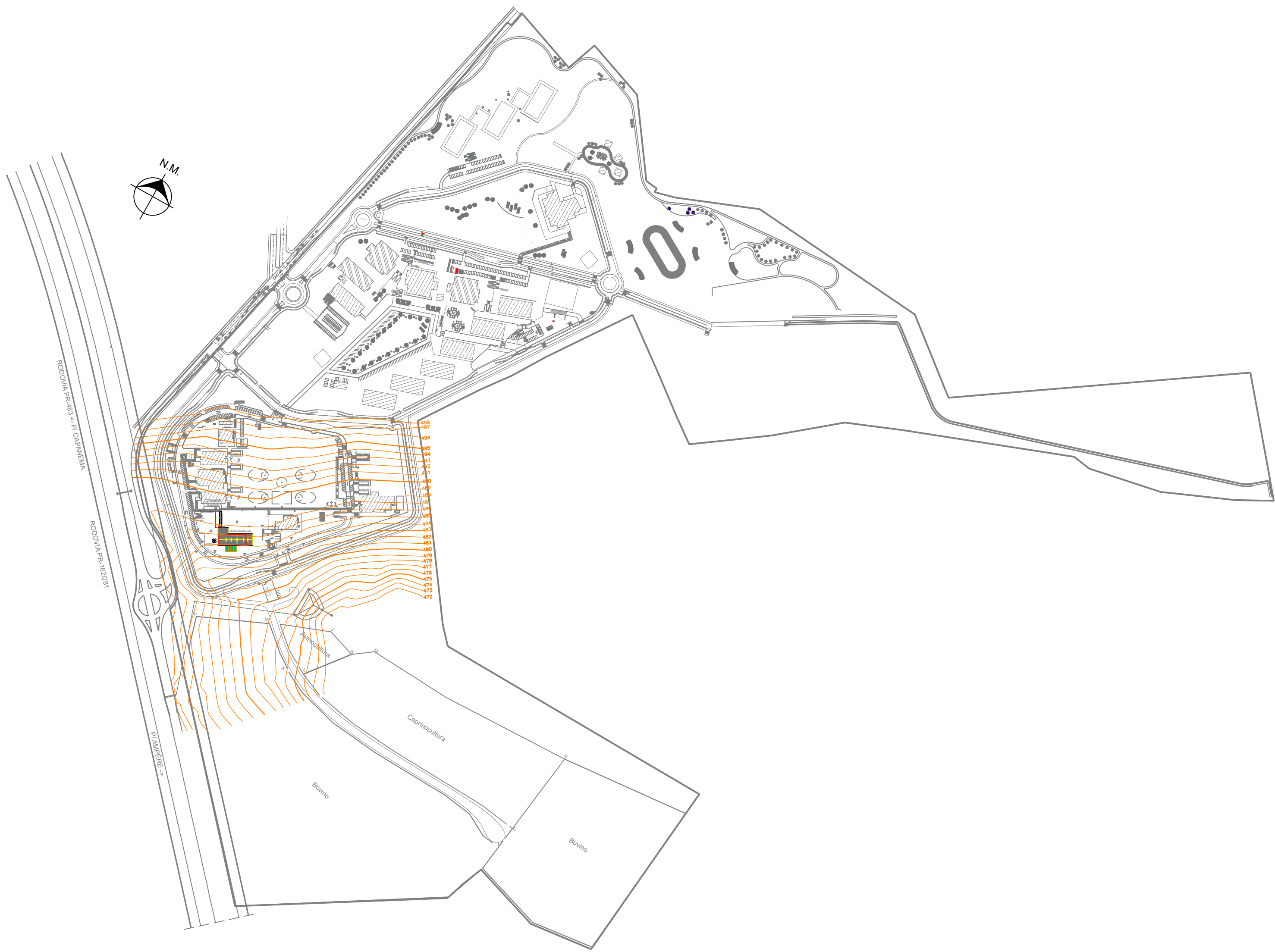
PLANTA DE LOCAÇÃO ESCALA 1/5000